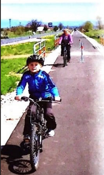
Ścieżka rowerowa w Rogoźniku

Projekt I etapu Historyczno-kulturowo-przyrodniczego szlaku wokół Tatr realizuje 13 polskich i słowackich samorządów – Gmina Czarny Dunajec, Miasto Nowy Targ, Gmina Szaflary, Miasto Kieżmark, Miasto Liptowski Mikulasz, Miasto Trstená, Obec Suchá Hora, Obec Hladovka, Obec Liesek, Obec Nižná, Obec Huncovce, Obec Vrbov. Partnerem Wiodącym jest Gmina Czarny Dunajec. Projekt został dofinansowany ze środków Programu Współpracy Transgranicznej PL-SK 2007-2013, a jego wartość to blisko 5 mln EUR.