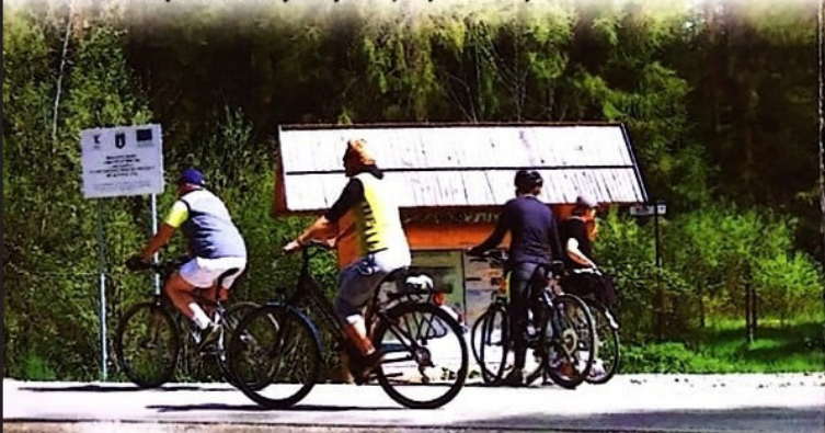
Miasto Nowy Targ – 12,6 km

Historyczno-kulturowo-przyrodniczy szlak wokół Tatr to zakrojone na wielką skalę transgraniczne przedsięwzięcie, będące efektem zainicjowanej przez Euroregion „Tatry” w 2004 roku wieloletniej współpracy polskich i słowackich samorządów. Projekt zakłada docelowo realizację liczącej ponad 250 km pętli wokół Tatr z trasami rowerowymi, narciarskimi i biegowymi. Przebiega ona z Nowego Targu przez położone po obu stronach Tatr historyczno-kulturowe krainy Podhala, Orawy, Liptowa i Spisza. Powstaje unikatowa atrakcja turystyczna umożliwiająca aktywny wypoczynek, promująca zdrowe spędzanie wolnego czasu oraz bezpieczne i przyjazne dla środowiska naturalnego zwiedzanie na rowerze miejsc o niepowtarzalnych walorach krajobrazowych, kulturowych, historycznych i przyrodniczych.