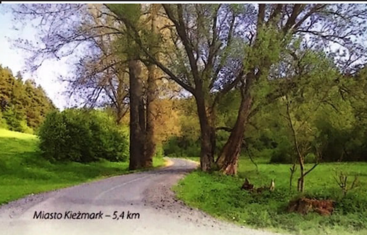
Miasto Kieżmark – 5,4 km

O wyjątkowej atrakcyjności Szlaku wokół Tatr świadczą wspaniałe rozpościerające się praktycznie z każdego miejsca widoki, sąsiedztwo kilku parków narodowych, obfitość terenów o najwyższych walorach przyrodniczych, np. torfowiska w Gminie Czarny Dunajec, Rezerwat „Bór na Czerwonym” w Nowym Targu, rezerwat geologiczny „Skalka Rogoźnicka”, mnogość zabytków – obiektów sakralnych (np. kościoły św. Anny i św. Katarzyny w Nowym Targu, Sanktuarium Maryjne w Ludźmierzu, wpisany na listę UNESCO kościół artykularny w Kieżmarku, synagoga w Liptowskim Mikulaszu, zamków (zamek w Kieżmarku, mur obronny zamku Szafliarskiego), relikwów dawnej zabudowy wiejskiej (zespół drewnianych budynków w Chochołowie wpisany na listę UNESCO) i miejskiej (zabytkowe centra miast Nowego Targu, Kieżmarku, Trsteny, Liptowskiego Mikulasza, dworki czarnodunajeckie), bliskość muzeów, galerii sztuki, miejsc rekreacji i atrakcji sportowych np. Aquapark Tatralandia, Ośrodek Kajakarstwa Górskiego i ośrodki narciarskie w Liptowskim Mikulaszu, kąpieliska termalne we Vrbovie, obiekty sportowe w Nowym Targu i Czarnym Dunajcu).