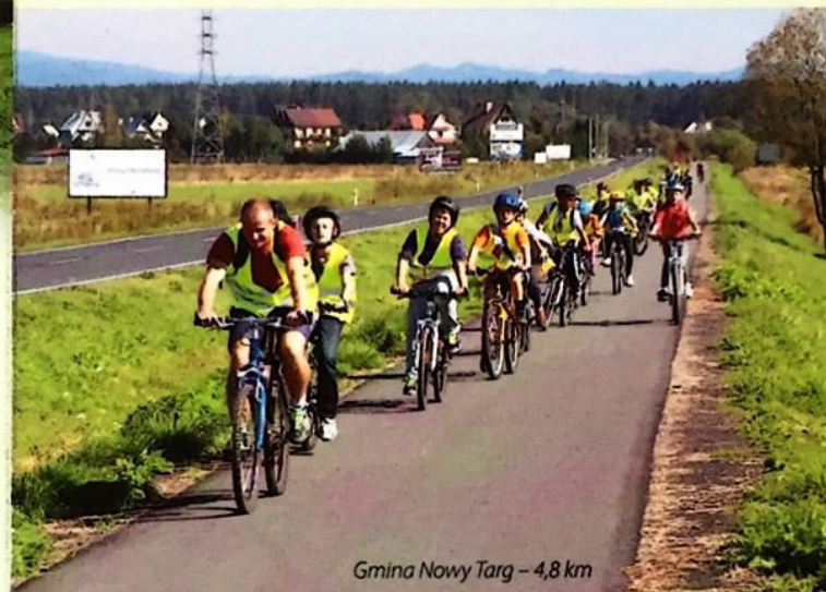
Gmina Nowy Targ – 4,8 km

Euroregion „Tatry” wraz z polskimi i słowackimi samorządami przygotowuje do realizacji II etap budowy tras rowerowych w ramach Historyczno-kulturowo-przyrodniczego szlaku wokół Tatr. Prowadzić będą one na wschód od Nowego Targu do granicy ze Słowacją na kładce w Sromowcach Niżnych i dalej po stronie słowackiej.