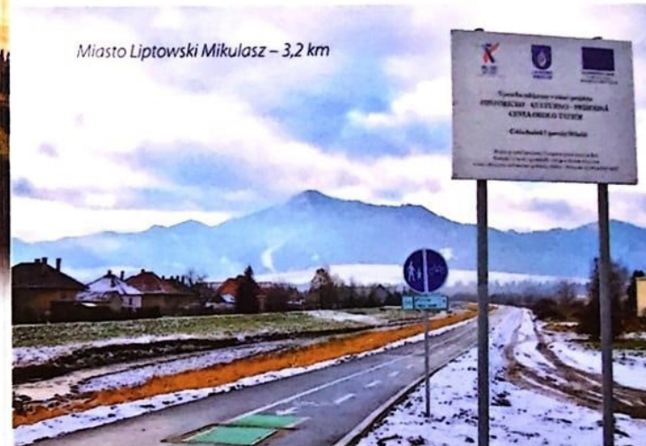
Miasto Liptowski Mikulasz – 3,2 km

Najdłuższy nieprzerwany transgraniczny odcinek będzie liczył 35 km i prowadził z Nowego Targu trasą dawnej linii kolejowej do granicy słowackiej w Suchej Horze i dalej do miasta Trstená. Najwięcej kilometrów tras rowerowych powstanie w gminie Czarny Dunajec – 31,8 km oraz mieście Nowy Targ – 12,6 km, a po stronie słowackiej w mieście Kieżmark – 5,4 km i miejscowości Liesek – 5,7 km.