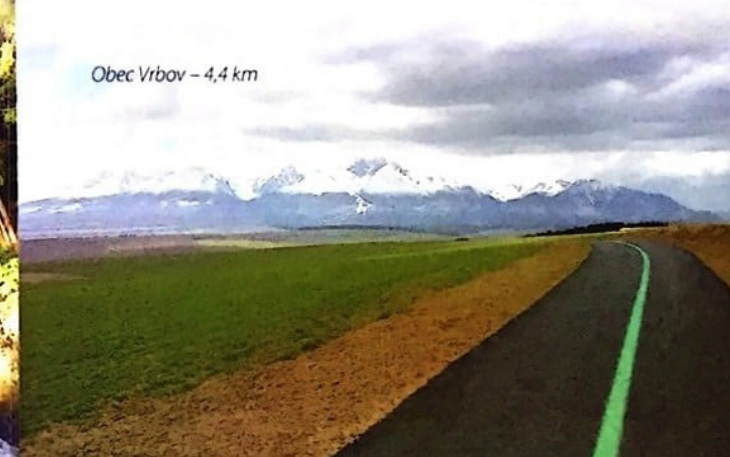
Obec Vrbov – 4,4 km

W ciągu Szlaku wokół Tatr znajdują się wyremontowane w ramach projektu zabytkowe mosty kolejowe w Ludźmierzu, Podczerwonem, Suchej Horze, Hladovce, Liesku, Trstenie. Na trasie zaprojektowano również miejsca widokowo-postojowe oraz parking dla użytkowników szlaku w Czarnym Dunajcu.