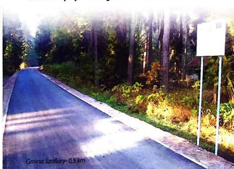
Gmina Szaflary – 0,5 km

Już dziś gotowe są trasy rowerowe biegnące po dawnym nasypie kolejowym od miasta Nowego Targu przez Zaskale, Rogoźnik, Stare Bystre, Czarny Dunajec, Podczerwone do granicy ze Słowacją w Suchej Horze. Dostępne są także trasy po stronie słowackiej w Liptowskim Mikulaszu, Kieżmarku, Vrbovie. Aktualnie trwają intensywne prace na odcinku od granicy w Suchej Horze przez Hladovkę, Liesek do miasta Trstená. Od września 2015 roku zapraszamy do korzystania z 74 km ścieżek rowerowych z nawierzchnią asfaltową lub szutrową powstałych w ramach I etapu Historyczno-kulturowo-przyrodniczego szlaku wokół Tatr.