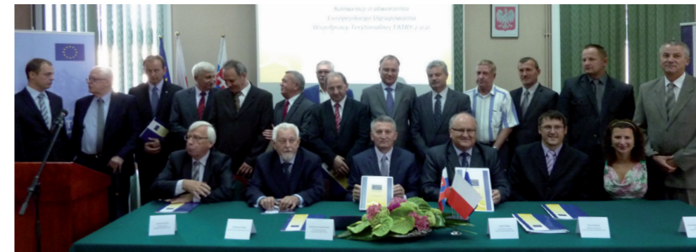
Podpisanie Konwencji, Nowy Targ, 14 sierpnia 2013 r.

nym), która może m.in. nabywać mienie, zawierać umowy, zatrudniać pracowników. Równocześnie powstaje podmiot, który powinien uzyskać nie tylko akceptację społeczną i ekspertów, ale zwłaszcza polityczną i stać się poważnym partnerem dla krajowych i europejskich organów i instytucji. Musimy sprawić, aby władze obu naszych krajów akceptowały EUWT TATRY jako swojego partnera przy rozstrzygnięciu wszystkich kwestii dotyczących współpracy transgranicznej. Dotychczas tak nie było i nie jest. EUWT jest pierwszą formacją, która umożliwia zrzeszenie się samorządów różnych państw członkowskich bez wcześniejszego podpisania międzynarodowej umowy ratyfikowanej przez narodowe parlamenty. Wystarczy formalna zgoda ministerstw poszczególnych krajów na utworzenie takiego ugrupowania. I to jest kolejna zasadnicza zmiana.