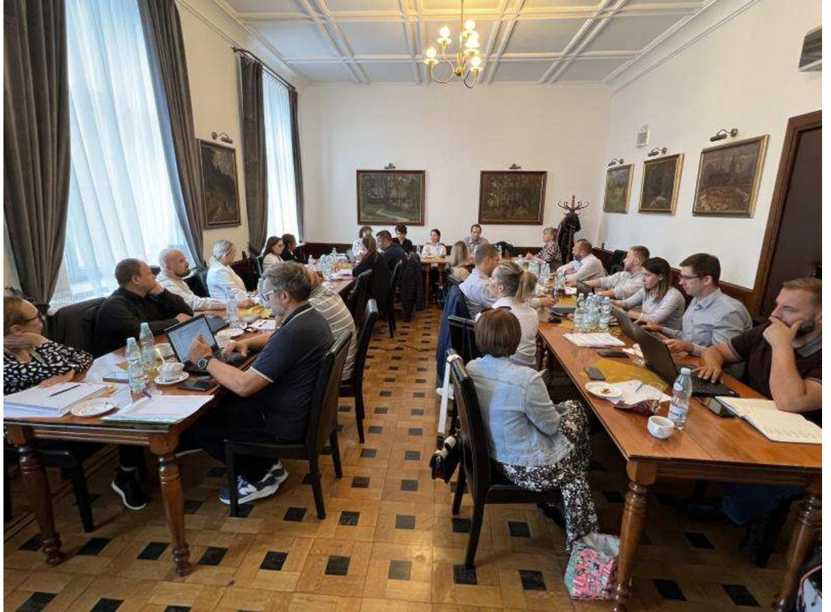
Stretnutie v Katowiciach

Verím, že aj naďalej budeme túto našu spoluprácu prehlbovať a rozvíjať a tvorivo prispievať nielen k zachovaniu hodnôt, ale aj partnerstiev a kontaktov prostredníctvom realizácie ďalších úspešných cezhraničných projektov.